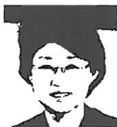
김승희 처장 식품의약품안전처