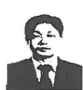
김성호 국장 식품의약품안전처 • 식품의약품안전처 소비자위해대응국장 • 서울대 의학 석사